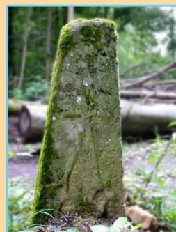
Schlüsselstein an der Mündung des Schlierbaches im Neckartal (Vorder- und Rückseite). Die Jahreszahl lautet: 1443.