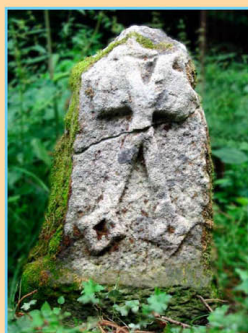
Schlüsselstein am Weg oberhalb der Büchelersklunge.