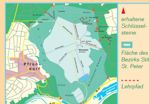
Lage der noch vorhandenen Schlüsselsteine, hypothetisch ergänzt um die etwa 7,5 km 2 große Fläche des dem Stift St. Peter übertragenen Bezirks (nach der Grenzbeschreibung bei Gabriel Biel).