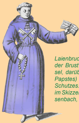
Laienbruder des Stifts St. Peter, auf der Brust die gekreuzten Schlüssel, darüber die Tiara (Krone des Papstes) als Zeichen päpstlichen Schutzes. Nach einer Zeichnung im Skizzenbuch des Nikolaus Ochsenbach, entstanden um 1580.