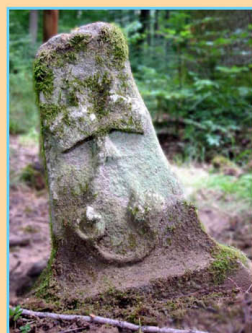
Schlüsselstein im Wald „Süßer Wasen“, etwa 300 m nördlich vom Standort dieser Tafel.

Die Schlüssel sind die Attribute des Apostels Petrus. Sie kamen auf die Marksteine, weil Petrus (eingedeutscht: Peter) zugleich Namenspatron des Stifts und persönlicher Heiliger des Stifters Graf Eberhard war. Auch auf den blauen Kutten der im Stift wohnenden Brüder zum Gemeinsamen Leben waren die Schlüssel angebracht.