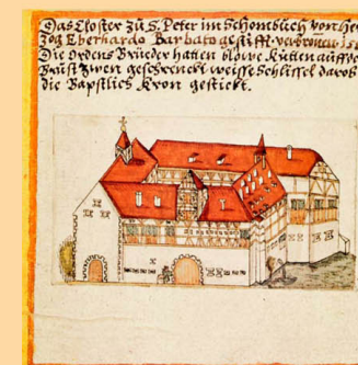
Skizze des Stifts St. Peter auf dem Einsiedel, entstanden um oder wenig vor 1580 (Skizzenbuch des Nikolaus Ochsenbach).